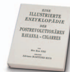
Buch: „Enzyklopädie postrevolutionärer Havanna-Zigarren“