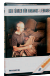
CD-Rom: „Führer für Habanos-Liebhaber“

Für Nutzer der neuen Medien empfiehlt sich die CD-Rom „Führer für Habanos-Liebhaber“. Per Mausclick kann man sich am Computer durch die Vielfalt der optisch hervorragend präsentierten Themen „klicken“, vom Tabakanbau bis zur Fertigung der Habanos in den