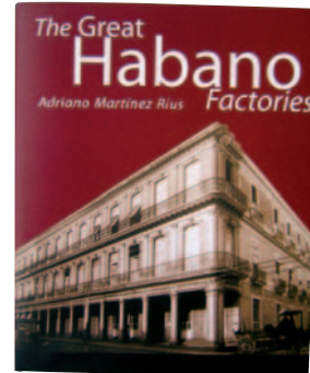
Buch: "The Great Habano Factories"

getragenen Fakten, eine Fülle, wie sie wohl einzigartig ist.