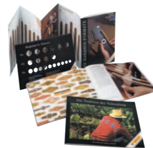
Booklet: „Die Tradition der Vollendung“

Wissen über Habanos in kompakterer und konzentrierter Form als dieser gibt es nicht. Das Booklet „Die Tradition der Vollendung - Der „Führer für Habanos-Liebhaber“ verdient die Bezeichnung, ein wirkliches Muss für jeden Habanos-Liebhaber zu sein. Es informiert eindrucksvoll und abwechslungsreich über die Welt der Habanos. Detailliert wird beschrieben, wie eine Habano entsteht, vom Anbau des Tabaks bis zur Fertigung in den Cigarrenmanufakturen Havannas. Anfänger wie Fortgeschrittene erhalten außerdem kompakte Informationen über die Auswahl von Cigarren, die Lagerung, das Anschneiden und Anzünden.