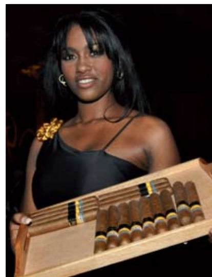
Auf der Gala präsentierte Habanos S.A. die Gran Reserva Cohiba Siglo VI.

Absoluter Höhepunkt des Festivals war die Vorstellung der Gran Reserva Cohiba Siglo VI auf der Abschlussgala am Freitag. Diese Cigarre ließ selbst erfahrene Cigarrenraucher in Verückung geraten. Eine Gran Reserva ist etwas ganz besonderes. Der Wunsch vieler Aficionados nach intensiv und lange gelagerten Tabaken war in den letzten Jahren immer größer geworden. Sowohl Deckblatt, als auch Umblatt- und Einlagetabake sind bei einer Gran Reserva mindestens fünf Jahre reifegelagert. Die Gran Reserva Cohiba Siglo VI, die erste Gran Reserva überhaupt, trägt zusätzlich die Bezeichnung „Cosecha 2003“. Diese Angabe bezieht sich auf das Jahr der Ernte. Weltweit wird es nur 5.000 nummerierte Kisten mit jeweils 15 Stück dieser in der Manufaktur El Laguito gefertigten Kostbarkeiten geben. Traditionell werden auf der Abschlussgala mehrere Humidore versteigert, deren Erlös dem cubanischen Gesundheitssystem zugute kommt. Trotz international angespannter wirtschaft-