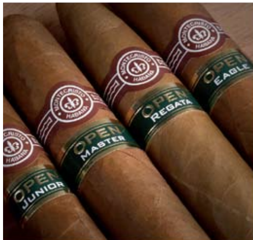
Die vier Formate der neuen Linie „Montecristo Open“

über ein Robustoformat, eines der beliebtesten Formate überhaupt. Die Trinidad Robusto T ist dem 40jährigen Bestehen der Marke gewidmet, die lange Zeit nur Diplomaten als Geschenk überreicht wurde. Vor nunmehr 10 Jahren führte Habanos S.A. die Marke weltweit offiziell ein.