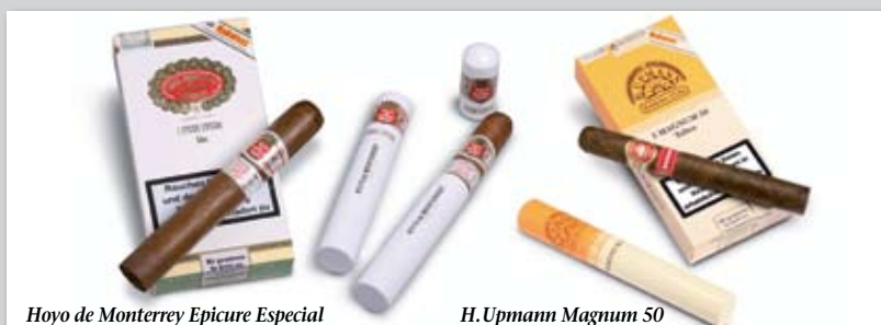
Hoyo de Monterrey Epicure Especial

nium-Tubo. Die mit Zedernholzeinlage versehenen Tubos bieten den Cigarren mechanischen Schutz und verhindern ein Austrocknen über mehrere Wochen. Sie eignen sich so auch für das Mitnehmen auf Reisen.