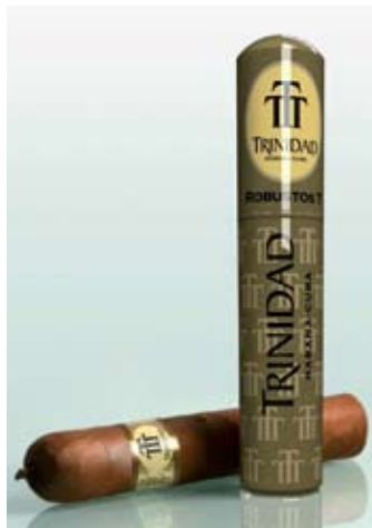
Die Trinidad Robusto T