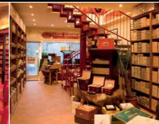
La Casa del Habano Köln Hähnenstr. 2-4 Geschäftszeiten: Montag bis Freitag 6 bis 22 Uhr, Samstag 7 bis 18 Uhr www.la-casa-del-habano.com