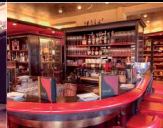
La Casa del Habano Nürnberg Hauptmarkt 9 Geschäftszeiten: Montag bis Freitag 11 bis 19 Uhr, Samstags 10 bis 19 Uhr www.casadelhabetano.de