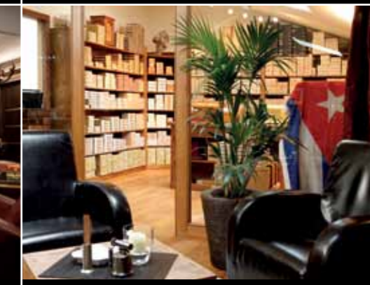
La Casa del Habano Düsseldorf (by Tabac Benden) Burghofstrasse 28 Geschäftszeiten: Montag bis Freitag 9 bis 24 Uhr, Samstag 11 bis 24 Uhr www.casahabano.com