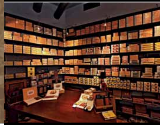
La Casa del Habano Hamburg Burhardstr. 15/ Chilehaus C Geschäftszeiten: Montag bis Samstag 10 bis 19 Uhr www.thecigarsmoker.com