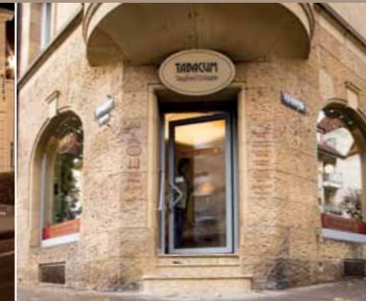
La Casa del Habano Stuttgart Vorsteigstraße 1 / Ecke Schwabstraße 177 Geschäftszeiten: Montag bis Freitag 9 bis 19 Uhr, Samstag 9 bis 16 Uhr www.tabacum.de