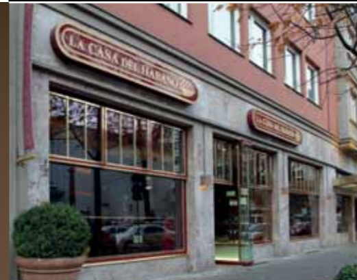
La Casa del Habano Berlin (im Savoy Hotel) Fasanenstraße 9-10 Geschäftszeiten: Montag bis Samstag: 11 bis 20 Uhr www.casa-del-habano.de