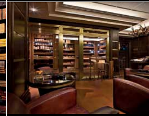
La Casa del Habano Düsseldorf (Kö Galerie) Königsallee 60c Geschäftszeiten: Montag bis Freitag 10 bis 20 Uhr, Samstag 10 bis 18 Uhr www.la-casa-del-habano-duesseldorf.de