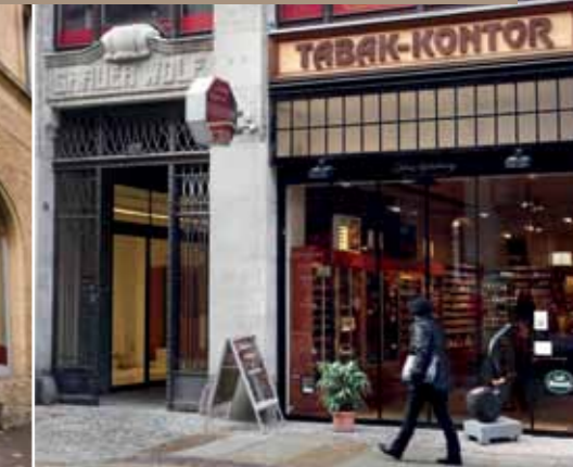
La Casa del Habano Leipzig Hainstraße 11 Geschäftszeiten: Montag bis Samstag 9 bis 20 Uhr www.lacasadelhabetano-leipzig.de