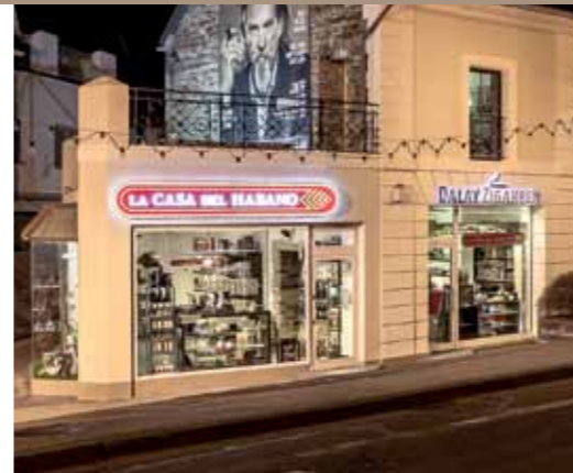
La Casa del Habano Saarbrücken Fürstenstraße 15b Geschäftszeiten: Montag bis Freitag 10 bis 19 Uhr, Samstag 10 bis 18 Uhr www.dalayzigarren.de